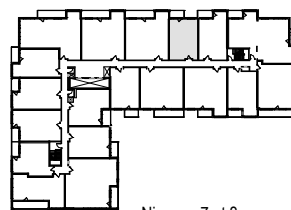
Niveaux 7 et 8